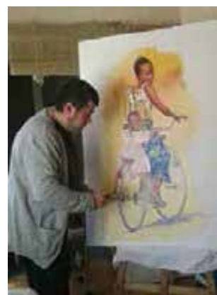
Exposición de pintura: Sala Sant Joan d'Arties. Vall d'Aran Del 14 al 20 de abril de 2014 Francisco Montes