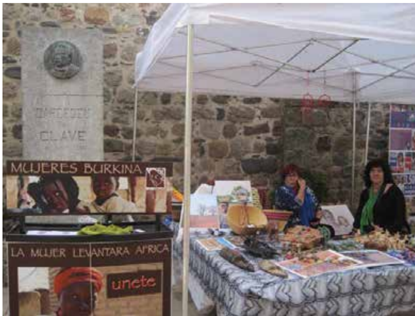
Fira d'entitats de Cardedeu